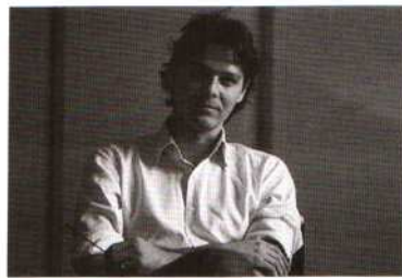
НИКОЛА ДЕ ПОНТИ