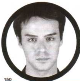
Gabriele Colangelo, stilista

● Cosa prendo: «Il concetto di multifunzionalità applicato alla vita quotidiana e ai consumi. Ha la capacità di abbattere la rigidità e di esaltare la versatilità». ● Cosa butto: «I retaggi antiestetici degli anni '80».