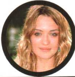
Carolina Crescentini, attrice e vincitrice del Premio L'Oréal Paris per il Cinema

● Cosa prendo: «Il concetto di multifunzionalità applicato alla vita quotidiana e ai consumi. Ha la capacità di abbattere la rigidità e di esaltare la versatilità». ● Cosa butto: «I retaggi antiestetici degli anni '80».